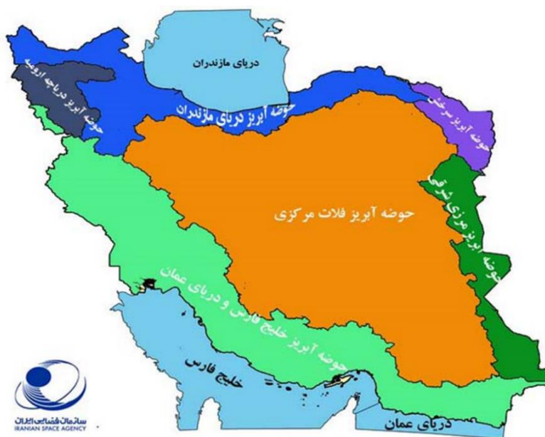
نقشه ۱: حوضه‌های اصلی آبخیز ایران

جدول شماره ۱ سهم هر حوضه در بارش بلندمدت را به صورت میانگین نشان می‌دهد.