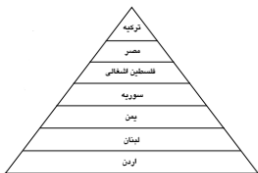
شکل (۲): وضعیت سطح بندی قدرت در جنوب غرب آسیا و حاشیه مدیترانه

بنابراین عدم توازن قوا ویژگی اصلی منطقه جنوب غرب آسیا و حتی خاورمیانه بوده و هست و در چنین فضای نابرابری طبیعی است که هر تحرک و دگرگونی قدرتی زنجیره‌ای از کنش‌ها و واکنش‌ها را به دنبال دارد و به تعبیر والت معمای امنیت را ایجاد می‌کند. پیامد ایجاد معمای امنیتی در منطقه بدون تردید بی ثباتی