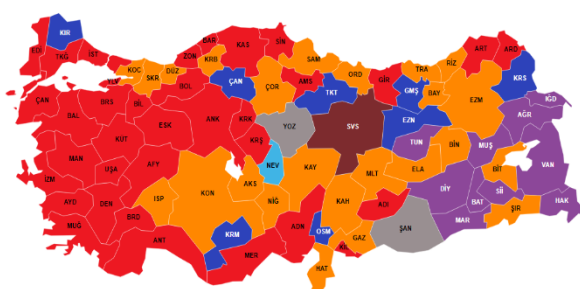
توزیع جغرافیایی آراء احزاب در انتخابات شهرداران

می‌شود در ۲۳ مارس ۲۰۲۴ برگزار شد. میزان مشارکت در این انتخابات بالا و برای دموکراسی این کشور، امیدبخش بود. در این انتخابات ۷۸/۵۵ درصد از واجدان شرایط (۴۸۲۵۶۵۴۱ نفر از میان ۶۱۴۳۰۹۳۴ کل واجدین شرایط) [۱] شرکت کردند. این میزان، ۷ درصد کم‌تر از انتخابات ریاست جمهوری ۲۰۲۳ بود، با وجود این جزو نرخ‌های مشارکت بالا در جهان محسوب می‌شود.