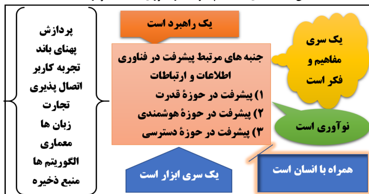
شکل ۱: جنبه‌های مختلف پیشرفت در فناوری اطلاعات و ارتباطات

-چه راهبردها و راهکارهایی (تدابیری) به هدف راهبری و تدابیر، شهرهای متاورسی آینده کشور لازم می‌باشد؟