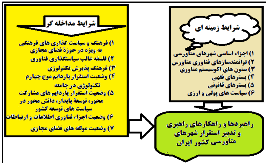
شکل ۲: شرایط زمینه‌ای و مداخله‌گر موثر بر راهبری و تدابیر استقرار شهرهای متاورسی آینده کشور ایران

شرایط زمینه‌ای نیز شرایط خاصی است که بر راهبردها و راهکارها اثر می‌گذارد که براساس یافته‌های تحقیق، ترکیبی از شرایط فنی، بسترهای فقهی، بسترهای قانونی و سیاست‌های پولی تقسیم بندی نمود. در ارتباط با شرایط فنی می‌توان به موارد