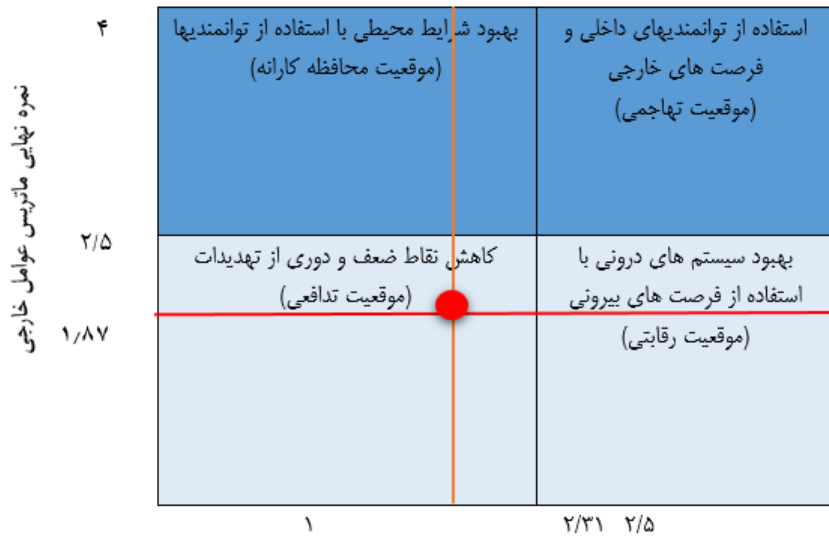
شکل ۲: نمره نهایی ماتریس عوامل داخلی

راهبردک است با توجه به جدول (SFAS) این فرصت را دارد که تمام عوامل قوت، ضعف، فرصت و تهدید را به چند عامل محدود کند. این کار با بررسی دوباره وزن های هر یک از جدول های EFE و IFE انجام می گیرد. جدول ۷ فهرستی از مهم ترین عوامل راهبردک خارجی و داخلی توسعه گردشگری ساحلی و دریایی در کرانه های مکران در قالب جدول SFAS است. این جدول مهم ترین عوامل را شامل می شود و به عنوان مبنا و پایه در تدوین راهبردها مورد استفاده قرار می گیرد.