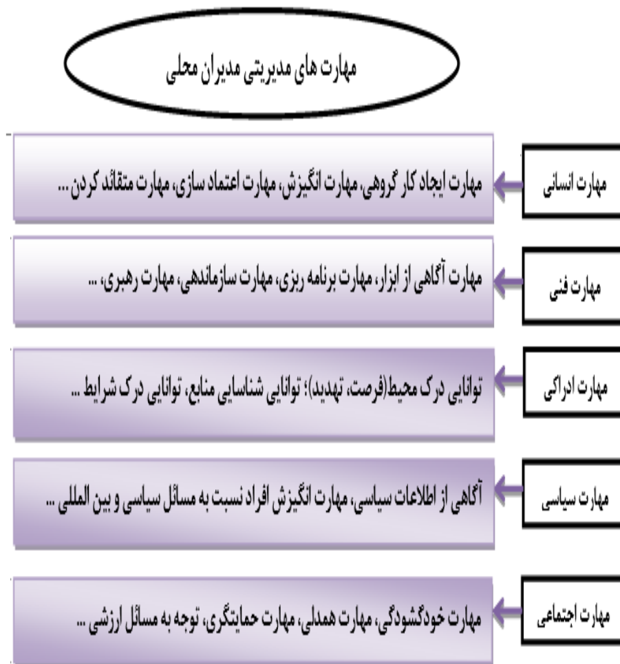
شکل ۱: مدل مفهومی تحقیق

طرح‌های هادی روستا، حسابداری برای تدوین بودجه و نظارت بر هزینه کرد دهیاری‌ها و برنامه‌ریزی روستایی برای تدوین برنامه‌های توسعه روستا است [۷]. البته مدیران محلی از این نوع مهارت بندرت به‌صورت کامل برخوردارند و نمی‌توان گفت که به‌طورقطع همه آنان از این نوع مهارت برخوردارند. مهارت ادراکی نیز از آن دسته از مهارت‌هایی است که به توانایی‌های شناختی و ادراکی مدیران از مجموعه‌ای که در آن فعالیت می‌کنند اشاره دارد. دستیابی به این نوع مهارت چارچوب کلی از مدیریت روستایی و شناخت مشکلات مدیریت را در عرصه روستا، برای مدیران نمایان می‌سازد و راهکارهایی برای تحقق اهداف مدیریتی و برطرف کردن مشکلات در این زمینه برای مدیران محلی ارائه می‌دهد مانند: درک محیط (فرصت و تهدید در سطح روستا)، توانایی درک شرایط روستاییان در ابعاد مختلف، قدرت