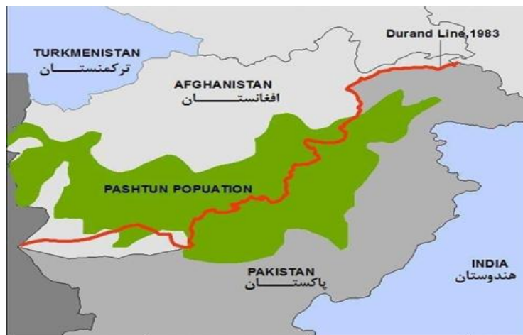
شکل ۲: مرز دیورند: جدایی قوم پشتون

اقلیت‌های مختلف درون کشور ممکن است برای خود هویت مستقل قائل باشند و دست به اقدامات جدایی طلبانه بزنند و دارای آرمان سیاسی باشند. این مسئله باعث تنش درون کشور می‌شود. از این اتفاقات نیز در بسیاری از کشورها و مناطق جهان مشاهده می‌شود. مانند جنبش‌های جدایی خواهی اهالی کبک در کانادا، اسکاتلندی‌ها در بریتانیا، کاتالون‌ها با سکیها در اسپانیا، کردها در عراق و مسلمانان چین در روسیه جز مهم‌ترین‌ها هستند. وقتی نیروهای خارجی به صورت مداخله جویانه و حامی نیروهای اقلیت باشند، مسئله بعد بین المللی پیدا می‌کند [۴]. خط