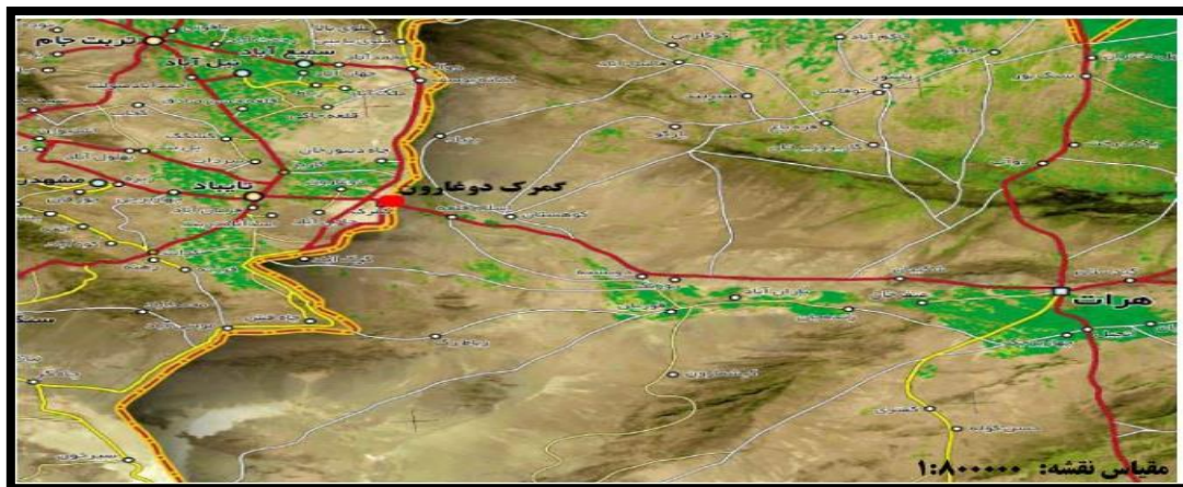
نقشه ۲: منطقه دوغارون واقع در مرز ایران و افغانستان

ب- استراتژی ایران در برابر احداث سد سلما توسط افغانستان: احداث سد سلما بر روی رودخانه فرامرزی هم در کشور افغانستان پیامدهای آبی، منطقه‌ای سیاسی، محیط زیستی و در کل هیدروپلیتیک حوضه آبریز را به دنبال خواهد داشت. ایران برای کاهش آسیب پذیری ناشی از احداث سد سلما چهار نوع استراتژی را پیش روی خود دارد: □ استراتژی اول: مبتنی بر تقویت روابط دیپلماتیک با