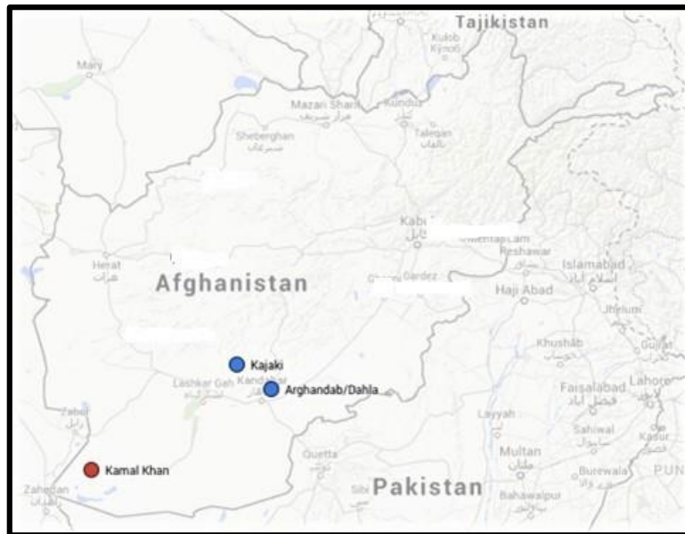
نقشه ۳: سدهای مهم ساخته شده بر روی هیرمند و سرشاخه‌های آن

قواعد آبی هلسینکی که در ۱۹۶۶ تصویب شد اثر زیادی در شکل‌گیری حقوق بین‌الملل آب داشته است. این قواعد بر دو اصل مهم بنا شده است. اول، اصل حق استفاده همه کشورهای یک حوضه بین‌المللی از آب‌های حوضه و دوم، اصل استفاده معقول و منصفانه از آب‌های حوضه بین‌المللی. ضمن اینکه اصل التزام به عدم آسیب رسانی به صورت غیرمستقیم و به‌عنوان یکی از ۱۱ عامل تعیین سهم استفاده معقول و منصفانه منظور شده است [۱].