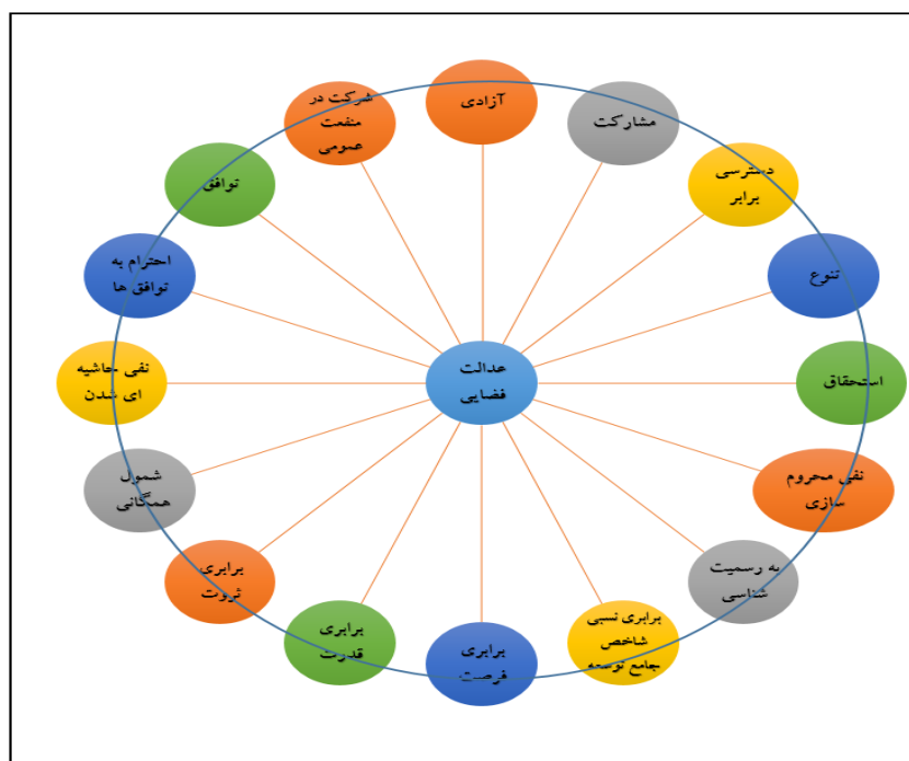
شکل ۱: معیارهای عدالت فضایی

مهمترین معیارهای عدالت فضای را می‌توان در قالب شکل ذیل به نمایش گذاشت: