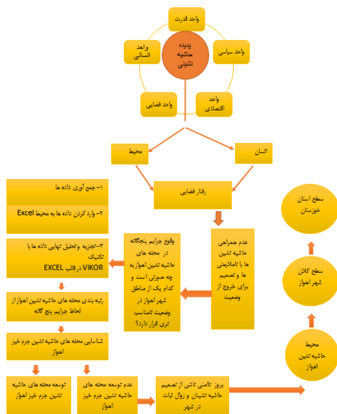
شکل ۱: مدل مفهومی پژوهش

ب: اعمال خشونت آمیزی که معمولاً به‌صورت جمعی است. مانند: درگیری و نزاع ۲. مقیاس ناحیه‌ای یا کلان شهر اهواز: فضاهای حاشیه نشین شهر اهواز به دلیل احتمال کاهش نظارت امنیتی پلیس بستری مناسب را جهت سکونت افراد مجرم و جنایتکار فراهم آورد. در این مقیاس ناامنی و جرم و جنایت به تدریج از محله‌های حاشیه نشین به سایر محله‌های اهواز نفوذ پیدا می‌کند و امنیت کلان شهر اهواز را با بحران روبرو می‌سازد. ۳. مقیاس منطقه‌ای یا استان خوزستان: پس از گسترش یافتن ناامنی و جرم و جنایت در سطح محلی و ناحیه‌ای، احتمال بازتاب عدم وجود یا کاهش ناامنی از کلان شهر