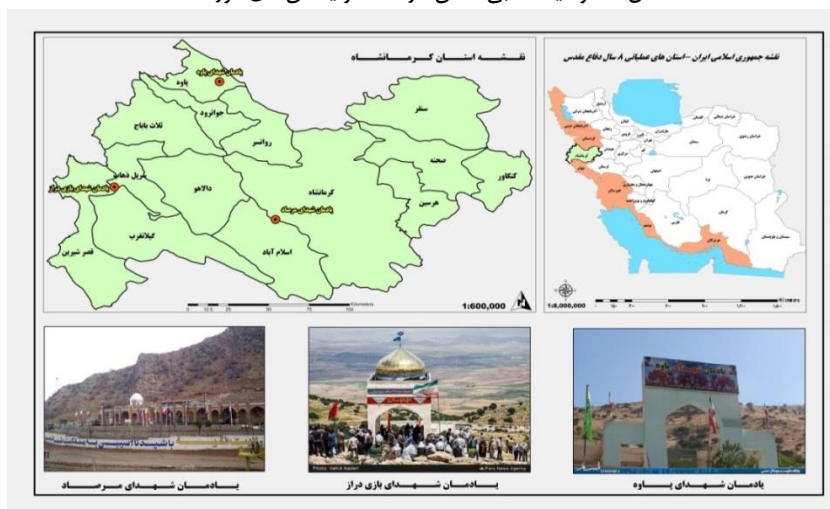
شکل ۲: موقعیت نسبی استان کرمانشاه و یادمان‌های مورد مطالعه

سوالات و پرسش نامه‌های مشابه در کتاب‌ها و مقالات و همچنین تایید متخصصان دانشگاهی عرصه گردشگری و توزیع ۶۰ پرسشنامه به‌عنوان پیش آزمون و پایایی آن نیز با محاسبه ضریب آلفای کرونباخ برابر ۰.۸۳۹ مورد تایید قرار گرفتند. در