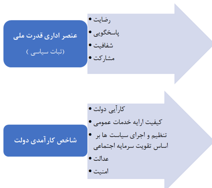
شکل ۴: مدل مفهومی پژوهش

۶- Walonick D.S. (1998). New Science as a Model for Organizational Development, available at http://www.survey-software-solutions.com/readings.htm .