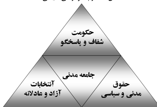
شکل ۱: هرم دموکراسی سیاسی

وابستگی بین دولت و مردم معرف رابطه بین آنها است. در قلب نظریه کوانتومی و نظریه عمومی سیستم ها این انگاره نهفته است که اساس هستنی بر روابط استوار است. به سخن دیگر، اگر روابط بین کوچک ترین ذرات هستی را حذف کنیم، هستی قابل تصور نیست. تمام اجزای یک سیستم با یکدیگر در تعامل هستند تا الگوهایی را شکل دهند و خود سیستم نیز با این الگوها تعریف می شود [۱۸]. تعمیم این سخن به نهاد دولت آن است که اولاً سازمان دولت بدون وجود رابطه بین مردم و حکومت قابل تصور نیست. ثانیاً با تغییر نوع رابطه بین دولت و مردم می توان الگوی