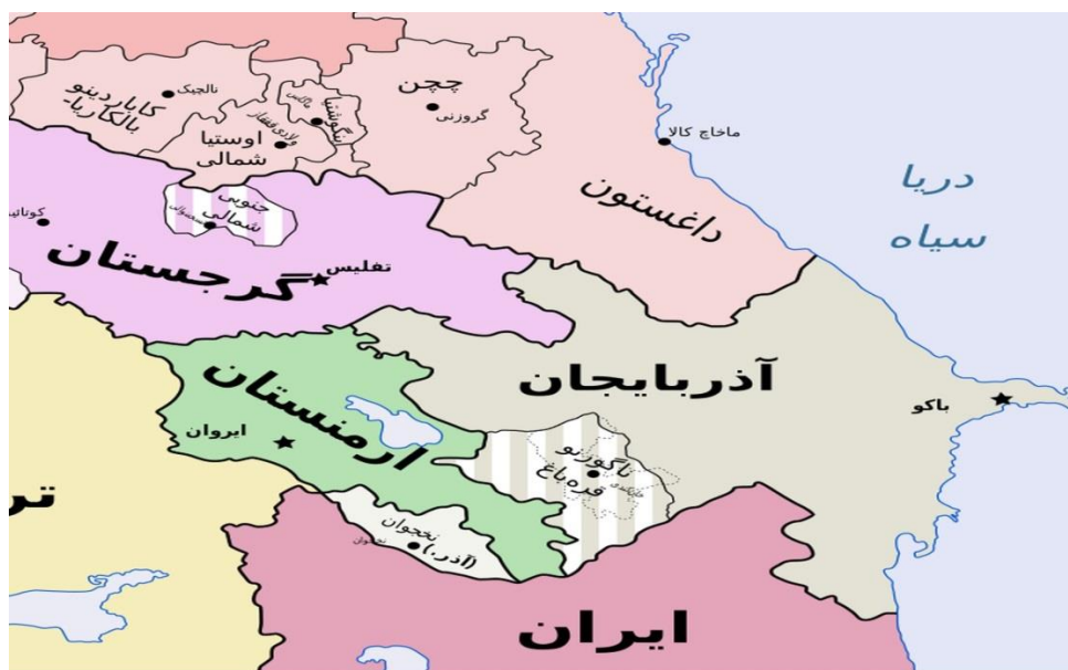
نقشه (۱): نقشه قفقاز

دلایل اهمیت استراتژیکی و ژئوپلیتیکی منطقه قفقاز چیست؟