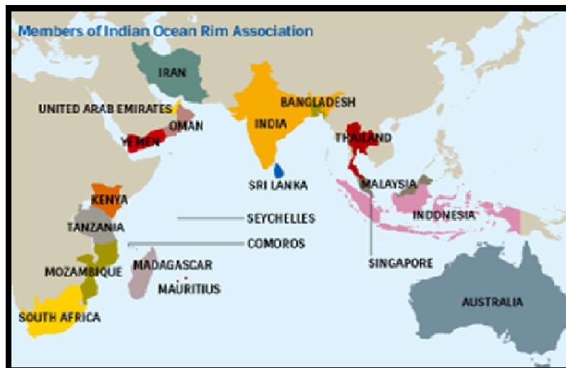
نقشه ۲) نقشه کشورهای عضو اتحادیه منطقه‌ای حاشیه اقیانوس هند

می‌شود. در چنین شرایطی، آب به نحو اجتناب‌ناپذیری به یک مقوله سیاسی و امنیتی تبدیل می‌شود. در نتیجه سیاست، امنیت و آب به یکدیگر پیوند می‌خورند [۴۶]. امتزاج عنصر قدرت به این سه مؤلفه دیگر هیدروپلیتیک را به ارمغان می‌آورد که هر کشور در مناقشات داخلی (استانی و شهری) و خارجی متأثر از مباحث آن می‌باشد.