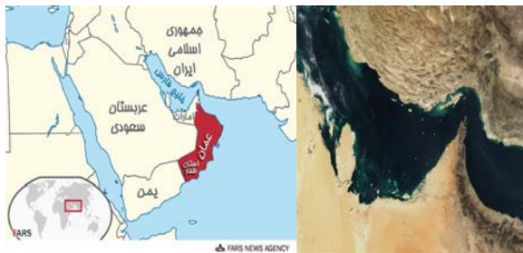
شکل ۱) موقعیت منطقه مورد مطالعه