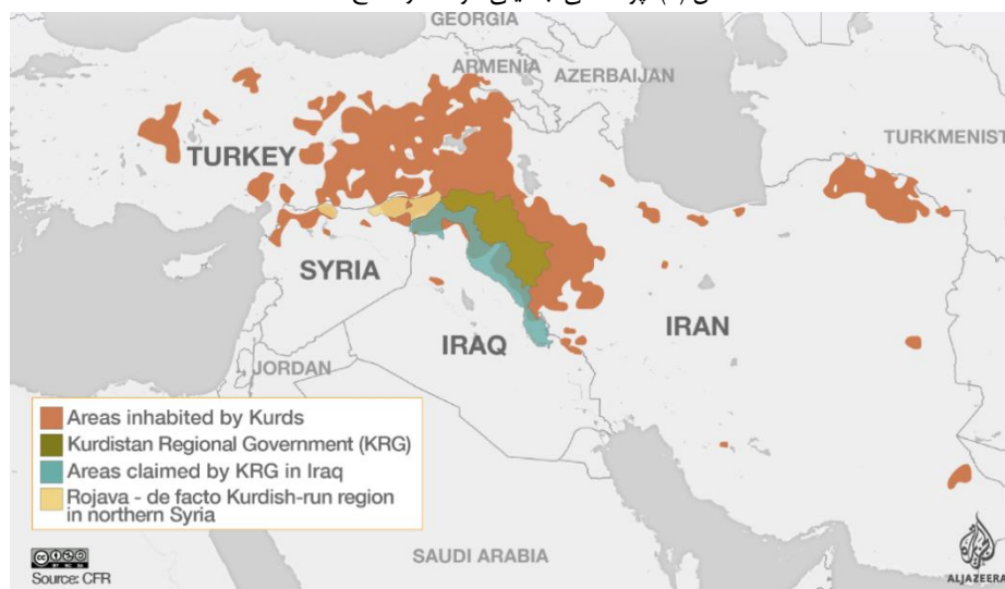
شکل (۱): پراکندگی جمعیتی کردها در سطح منطقه

گو اینکه شاید به‌توان تمام مسئله کردی را در قالب موضوع ناسیونالیسم کردی و ذیل مطالبات قوم‌گرایانه تبیین کرد که بر یکدیگر و مناطق جغرافیایی یکدیگر تأثیر و تأثر گذاشته‌اند و تا حدود زیادی دارای درجاتی از تشابه هستند اما به توجه به تفاوت‌های کنونی این چهار کشور دربرگیرنده قوم کرد، باید هر پرونده کردی را در ظرف سرزمینی خودش، سنجیده شود. به‌عنوان نمونه نمی‌توان عنوان کرد که تمام مطالبات قوم کرد در منطقه دارای رنگ و بوی دموکراتیک بوده است یا این که تمام مطالبات از جنس مبارزه مسلحانه و چریکی بوده است. به لحاظ تاریخی، کردهای عراق با حکومت مرکزی بغداد در طیفی از چالش‌های فرهنگی، اقتصادی و سیاسی به سر برده‌اند و به‌طور پیوسته با اصطحکاک‌های هویتی خود با دیگری مطالباتی را پی‌جویی کرده‌اند که اساس و ابتدای آن بر شاکله هویت مستقل کردی متمرکز بوده است و بنا به شرایط متفاوت خواسته‌های خود را با قالب‌های خودمختاری، حق تعیین سرنوشت و استقلال‌طلبی مطرح و ممزوج ساخته‌اند و جنبش‌ها گوناگونی در بین آن‌ها در دوران قیمومیت، پادشاهی و جمهوری‌های اول و دوم و سوم عراق پا