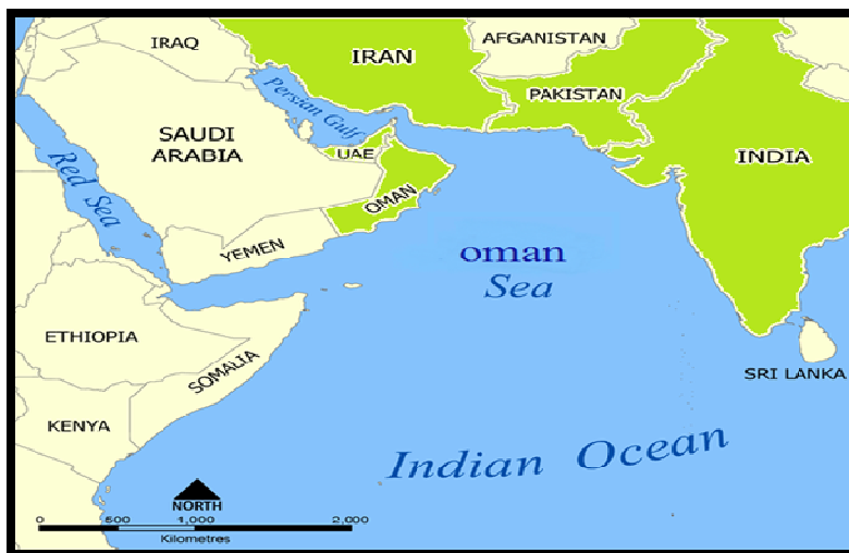
نقشه (۱) کشورهای سواحل دریای عمان

همان‌طور که در شکل شماره یک اشاره شده است؛ فرآیند هم‌گرایی در این مناطق ژئوپلیتیک دارای سطوح تدریجی و مراحل بالا است. از مرحله هم‌گرایی فنی، تخصصی آغاز می‌شود و در شرایط کاهش کدورت و افزایش صمیمیت بین اعضا و کشورهای منطقه به تدریج به سطوح بعدی و نهایتاً